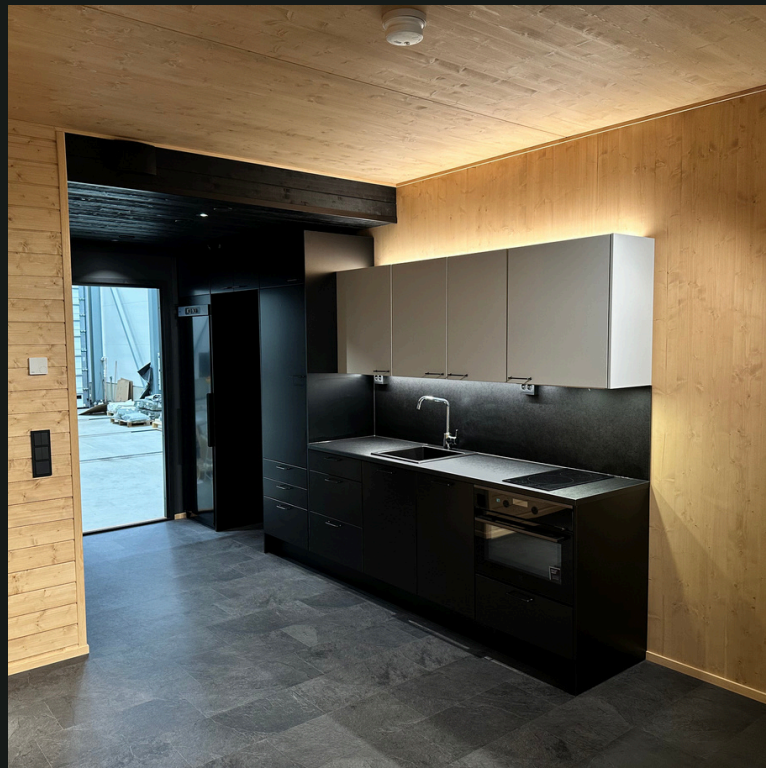
Moduulihuoneistojen rakentaminen tehtaalla