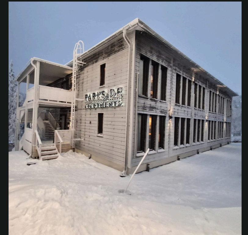
Ulko- ja sisäpuolen viimeistelytyöt